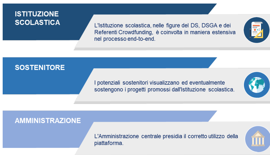
Figura 1 - I soggetti coinvolti

Gli attori coinvolti nel processo di crowdfunding sono le Istituzioni Scolastiche, i potenziali sostenitori e l'Amministrazione centrale del MI.