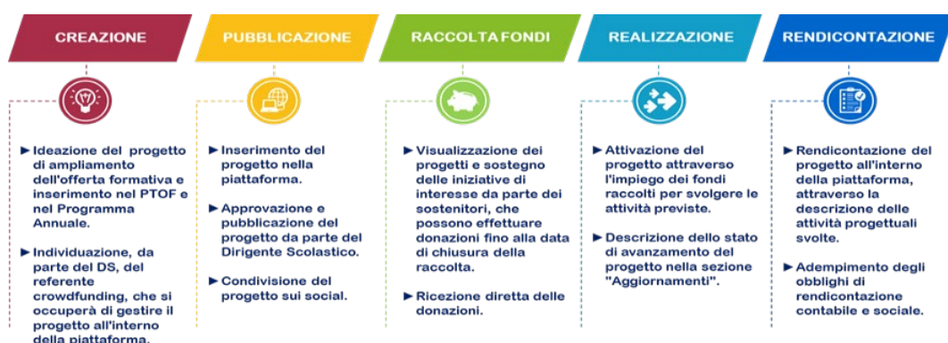
Figura 2 - Le fasi del processo di crowdfunding

Ciascuna fase si articola in specifiche attività di seguito descritte.